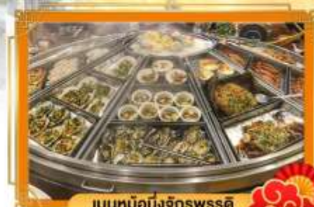
เมนูหม้อนึ่งจักรพรรดิ ชาบูสไตล์ไต้หวันจัด