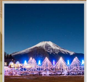
"YAMANAKAKO ILLUMINATION FANTASEUM"