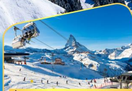
นั่งกระเช้าชมแมทเทอร์ฮอร์น