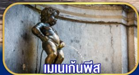
เมเนกันพีส์