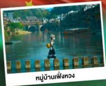
หมู่บ้านเฟิงหวง