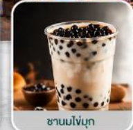
ชาวมโห่ก