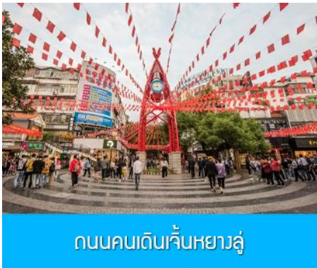
ถนนคนเดินจิ้นหยางลู่