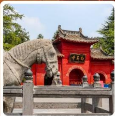
เจดีย์ม้าขาว