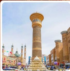
ตลาดนานาชาติต้าปาจา