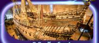
พิพิธภัณฑ์ทว่าซา