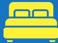
ห้องพักดับเบิล DOUBLE