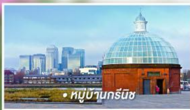
• หมู่บ้านกรีนิช