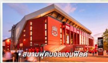
• สนามฟุตบอลแอนฟิลด์