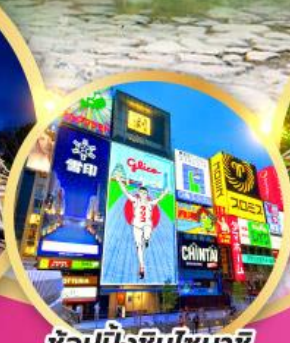
ช้อปปิ้งชินโซบายิ