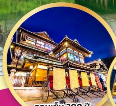
ออนเซ็น 300 ปี โตโจ ออนเซ็น