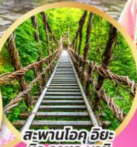
สะพานโอคุฮิยะ นิจู คาซุระบายิ