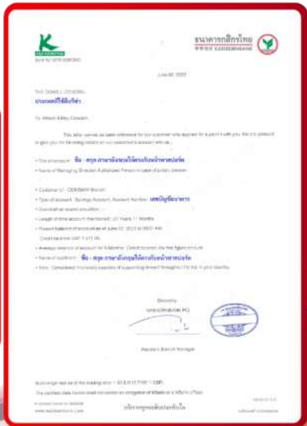
ตัวอย่าง Bank Guarantee ที่ผู้สมัครต้องยื่นกับธนาคาร