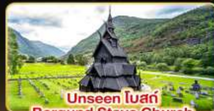
Unseen โบสถ์ Borgund Stave Church