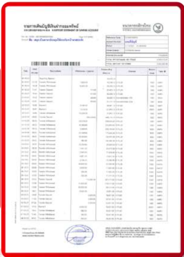
ตัวอย่าง Bank Statement ที่ผู้สมัครต้องยื่นกับธนาคาร

3.4 ปรับสมุดบัญชีธนาคารตัวจริง และเตรียมไปในวันที่ยื่นวีซ่า