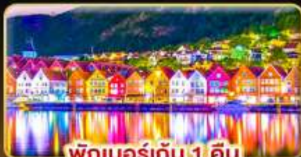
พักเบอร์เกน 1 คืน