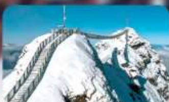
พิชิต 3 ยอดเขาดัง Rigi / Schilthorn / Glacier 3000