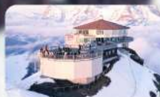
ทานอาหารที่ Piz Gloria ภัตตาคารที่หมุนได้ 360 องศา