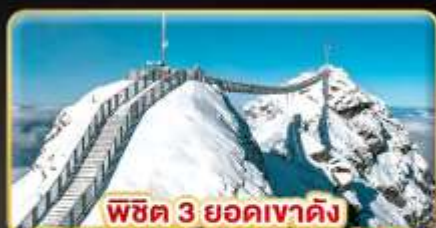
พีชิต 3 ยอดเขาดัง Rigi / Schilthorn / Glacier 3000