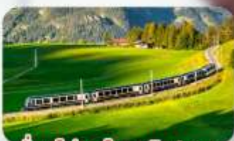
นั้งรถไฟสายโรแมนติก 2 สาย Golden Pass / Luzern Interlaken Express