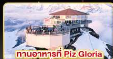
ทานอาหารที่ Piz Gloria ภัตตาคารที่หมุนได้ 360 องศา