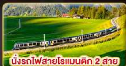
นั่งรถไฟสายโรแมนติก 2 สาย Golden Pass / Luzern Interlaken Express

📅 เดินทาง: 5-12 เม.ย. | 31 พ.ค.-7 มิ.ย. 69